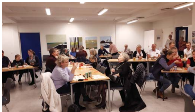
Både unge, gamle og dem midt mellem hyggede sig gevaldigt ved bordene, og adskillige dejlige præmier blev efterfølgende båret hjem i triumf

af bestyrelsen samt, som en nyskabelse, "trøstpræmier" til taberen af lodtrækningen, når to personer kunne råbe banko på samme tid.