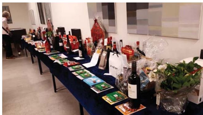
Et udsnit af de flotte præmier, før de fandt deres glade ejermænd

2021 skulle være ekstra festlig. Som billedet af gavebordene viser, var der både mange, store og overdådige præmier og sidegevinster fra vores gavmilde sponsorer blandt de lokale handlende. I køleskabet ventede desuden "dobbel op" på flæskesteg og ænder indkøbt